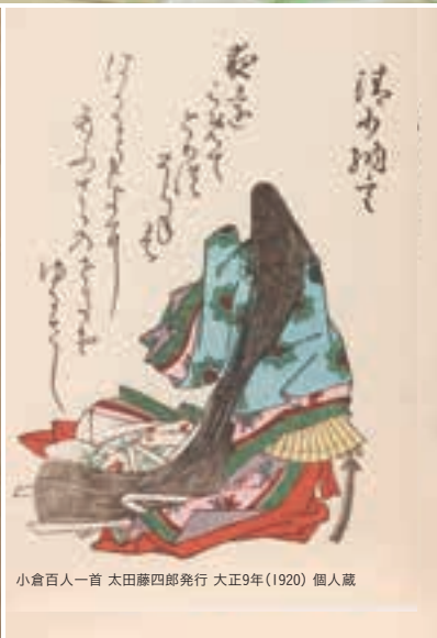
小倉百人一首 太田藤四郎発行 大正9年(1920) 個人蔵