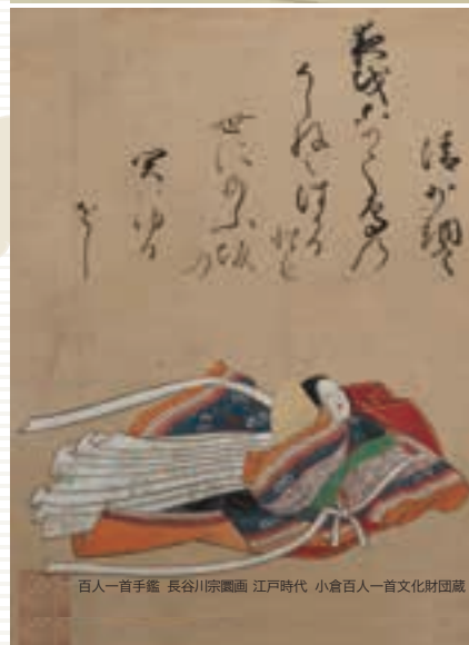
百人一首手鑑 長谷川宗綱画 江戸時代 小倉百人一首文化財団蔵