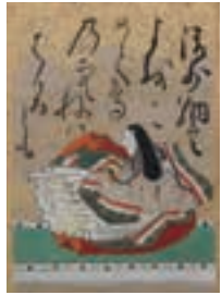
百人一首かるた 江戸時代 小倉百人一首文化財団蔵