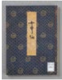
女歌仙 江戸時代 個人蔵