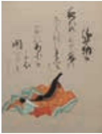
百人一首面帖 清原雪信画 江戸時代 小倉百人一首文化財団蔵

平安朝文学研究者、京都学園大学人文学部歴史文化学科教授。金沢市生まれ。京都大学博士(人間・環境学)。『源氏物語の時代—一条天皇と后たちのものがたり』(朝日新聞社、2007)にてサントリー学芸賞(芸術・文学部門)を受賞。著作は他に『紫式部集論』(和泉書院、2005)、林真理子氏との共著『誰も教えてくれなかった『源氏物語』本当の面白さ』(小学館、2008)、『私が源氏物語を書いたわけ』(角川学芸出版、2011)、『平安人の心で『源氏物語』を読む』(朝日新聞出版、2014)など。