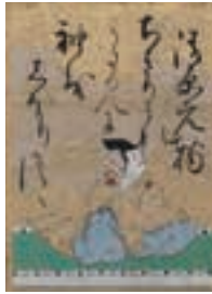
百人一首かるた 江戸時代 小倉百人一首文化財団蔵