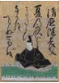
百人一首かるた 江戸時代 小倉百人一首文化財団蔵