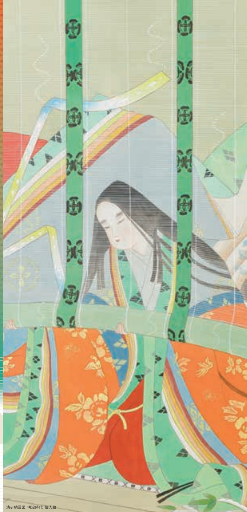
清少納言図 明治時代 個人蔵