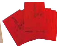
▲アニメ「ちはやふる」の台本