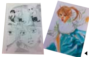
◀「ちはやふる」生原稿